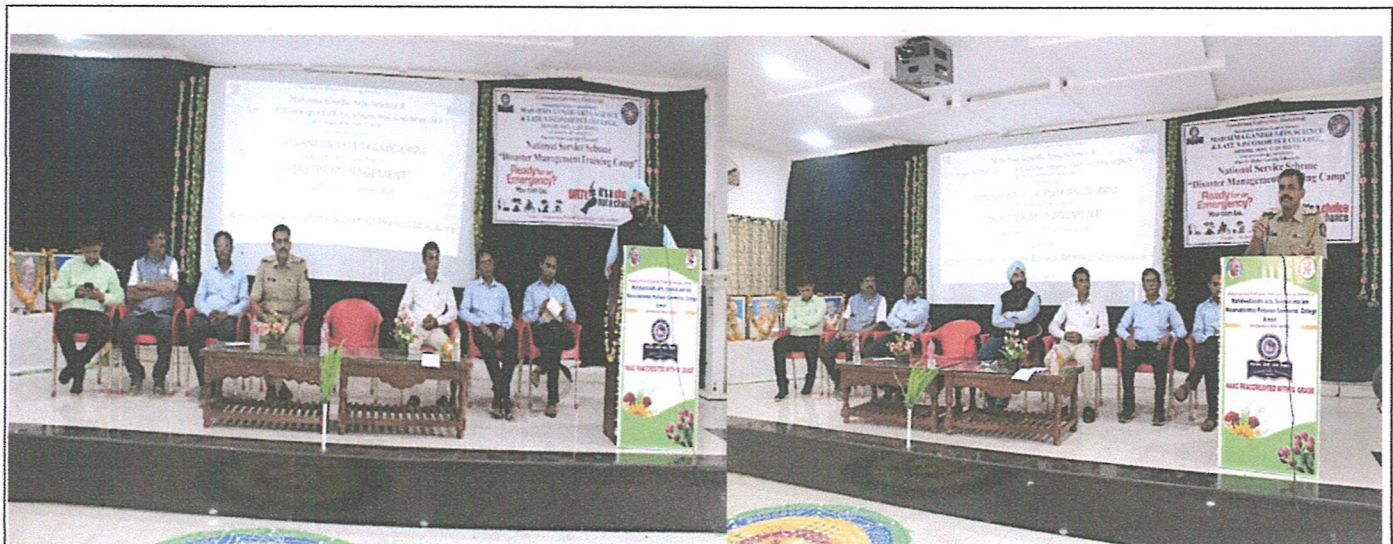
Inauguration of Disaster Management Workshop