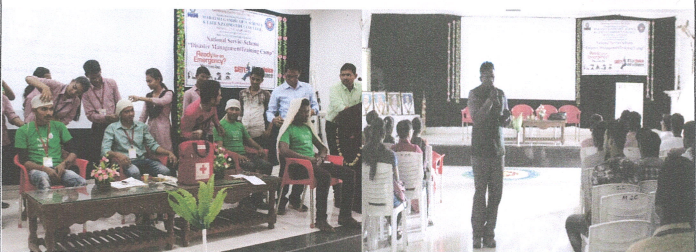
Training to the students about Disaster Management